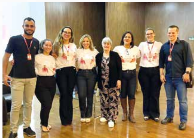
Ponto de Escuta Ativa na Faculdade

O "OAB vai à Faculdade" é outra iniciativa que aproxima os estudantes da prática jurídica, proporcionando insights sobre a atuação da Ordem dos Advogados do Brasil.