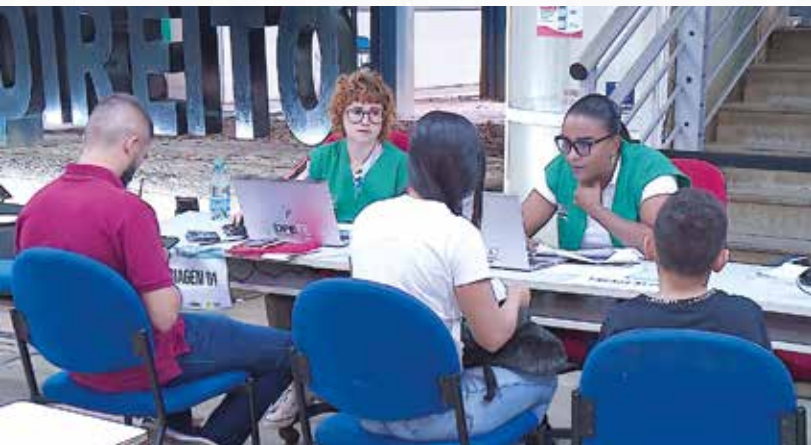
Dia D do programa Meu Pai Tem Nome