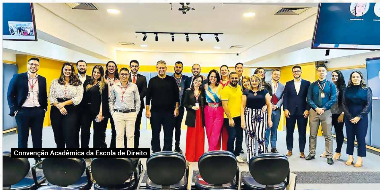
Convenção Acadêmica da Escola de Direito

A Escola de Direito realiza regularmente a "Convenção Acadêmica da Escola de Direito". Esse evento reúne alunos e professores para discutirem tendências e desafios do mundo jurídico. Além disso, o Programa de Iniciação Científica da UNIALFA tem se destacado por fomentar a pesquisa e o desenvolvimento de habilidades acadêmicas.