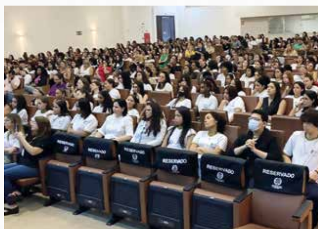
Ponto de Escuta Ativa na Faculdade

O "Dia D do programa Meu Pai Tem Nome", teve como objetivo realizar, de forma extrajudicial, o reconhecimento de paternidade/filiação, inclusive com a realização de exame de DNA, quando necessário, de forma gratuita. A Escola de Direito da ALFA EDUCAÇÃO através do termo de cooperação com a Defensoria Pública do Estado de Goiás – DPE/GO sediou um dos principais pontos de atendimento deste Dia D, oportunidade em que mais de 120 pessoas foram mobilizadas, dentre eles alunos de Direito, colaboradores administrativos, professores, defensores públicos e membros da OVG (Organização das